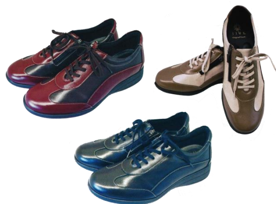
山羊コンフォートシューズ